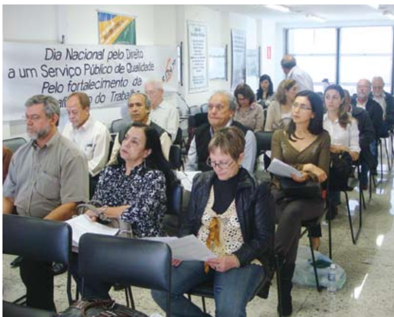
Reunião e assembleia na sede da DS/BH

De acordo com o resultado final, dos 28 indicativos propostos, 23 foram aprovados, quatro foram rejeitados e um (indicativo 10) foi considerado não apreciado.