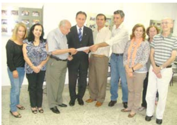
Auditores-Fiscais entregam reivindicações ao deputado

A PEC 555/2006 extingue a contribuição previdenciária de aposentados e pensionistas e o PLS 421/2007